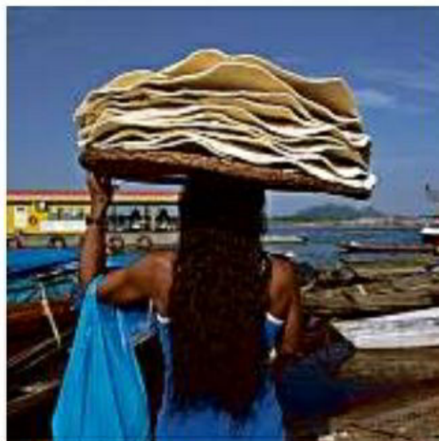
Mulher no porto do Queiroz Galvão, no Rio Negro