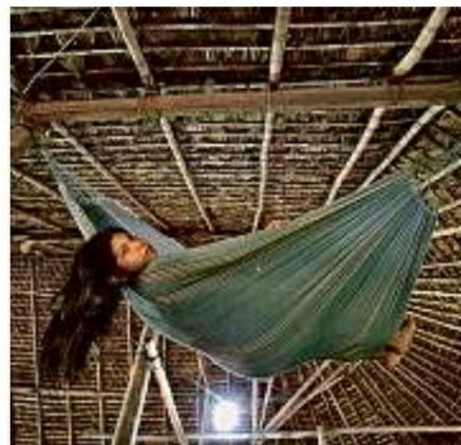
Menina baniwa, uma das 23 etnias de São Gabriel da Cachoeira

A Amidi, que representa mulheres de 13 diferentes povos da região, tem dois objetivos básicos: estimular ações de combate à violência doméstica e apoiar as artesãs na fabricação e comercialização das cerâmicas e das peças artesanais feitas a partir da fibra extraída das folhas da palmeira tucum. Ano passado, teve aprovado junto ao Fundo Casa um projeto de conscientização das mulheres sobre a invasão das terras por garimpeiros. “Temos muito o que falar sobre nosso território.”