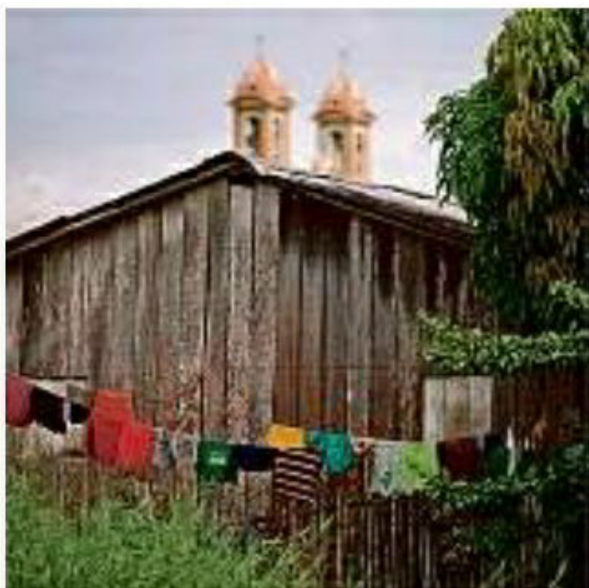
Casa em Taracuí, comunidade às margens do Rio Uapés