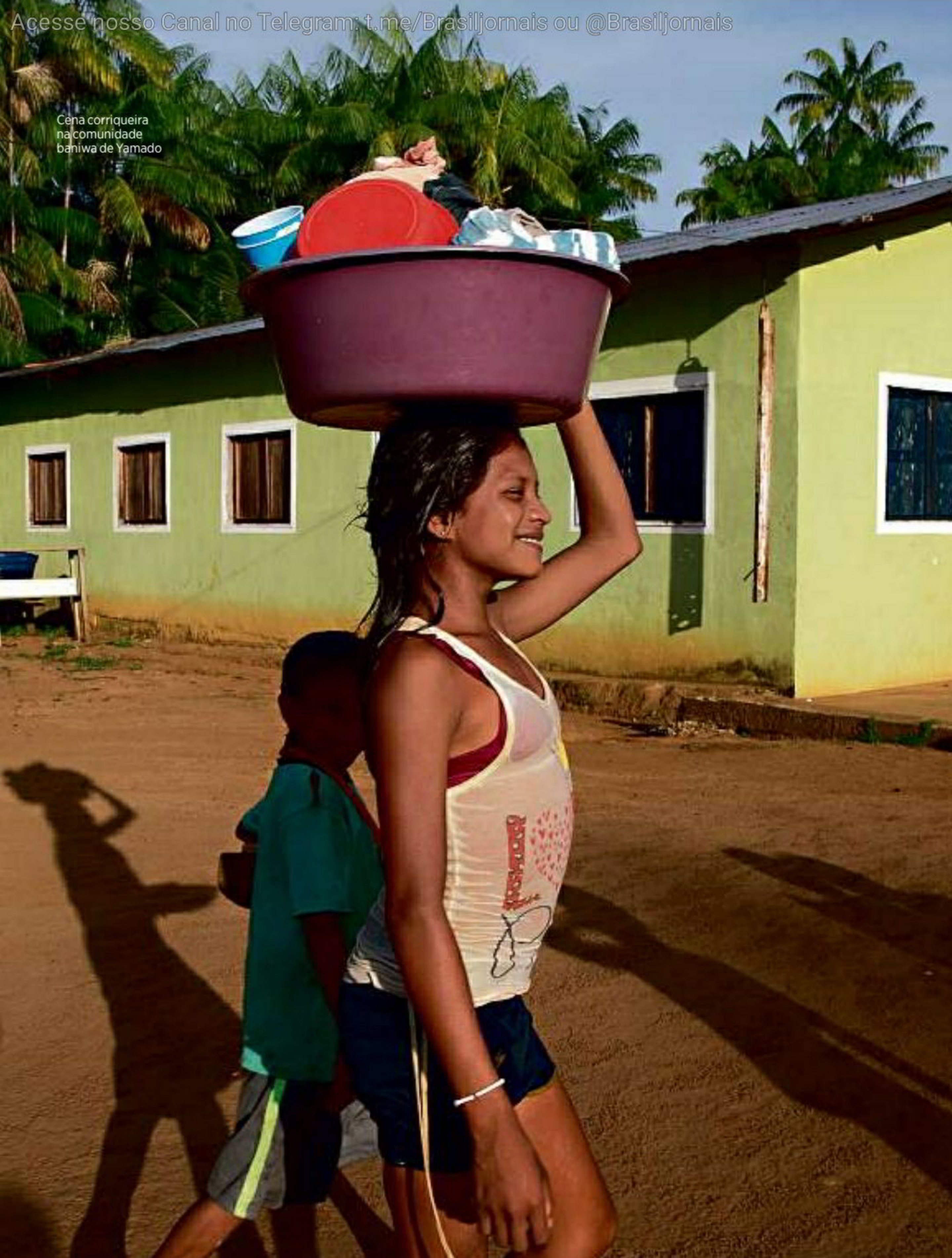
Cena corriqueira na comunidade baniwa de Yamado